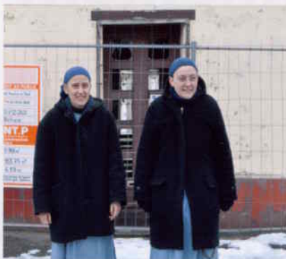
Témoignage des Petites Sœurs de la Communauté de l'Agneau de Béthune

«Nous sommes huit sœurs (140 dans le monde) et vivons dans un petit monastère construit en 2009 uniquement