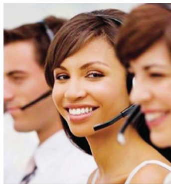
Duacom Douai vous ouvre ses portes, l'entreprise recrute des téléconseillers.

Duacom Douai ouvre ses portes le jeudi 26 octobre. Sur place : présentation du groupe et de ses activités. Visite des locaux. Double écoute avec un conseiller en poste. Temps d'échange avec l'équipe encadrante. Les personnes souhaitant postuler sont conviées à un mini entretien dès l'après-midi. Vous souhaitez participer ? Envoyez un mail à votre conseiller référent ou envoyez un mail à entreprise.npcO114@pe-emploi.net en précisant « Duacom ».